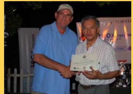
Guillermo Flores por Belimo ▲ SRL